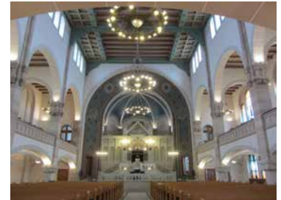
Synagoge Rykestraße Topographie des Terrors