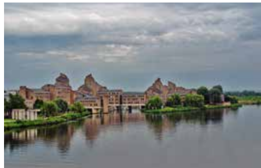
Gouvernement, Unterzeichnung des Vertrags von Maastricht 1992.