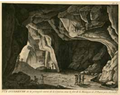
Eingang zur Grotte am Sint Pietersberg. Buchillustration von 1799