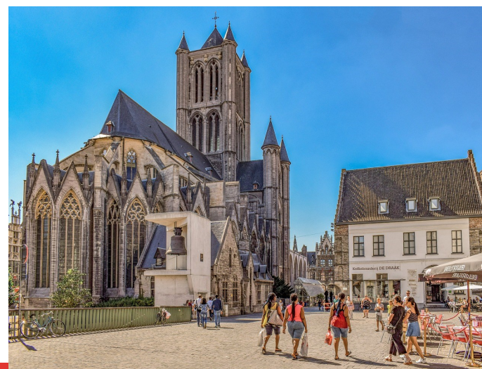
Sint-Niklaaskerk in Gent

https://auslandsgesellschaft.de/wp-content/uploads/2023/12/Uebersicht-Versicherungen-Auslandsgesellschaft-Bus.pdf